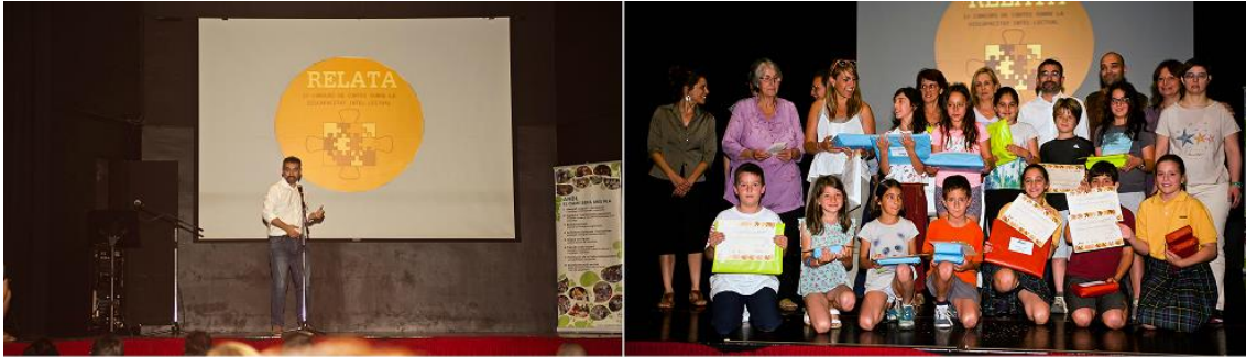
Foto de l'acte de lliurament de premis del 1r Concurs de Contes sobre la discapacitat intel·lectual (Juny 2017)

Tots els alumnes que han realitzat el taller, participaran en el concurs de contes. A partir del taller i haver obtingut informació sobre la temàtica, així com recursos didàctics i haver treballat el tema a l'aula, realitzaran els relats i formaran part del concurs amb totes les altres escoles participants.